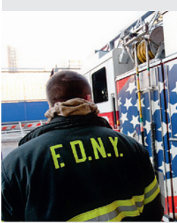
New Yorker Feuerwehrmann

riskierte sein Leben, um andere zu retten.